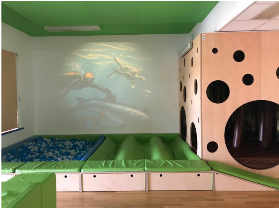
Vaje za koncentracijo, tehnike dihanja, čutna pot