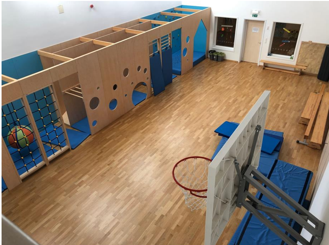
Žoganje, odzivne igre, plesne igre ob glasbi