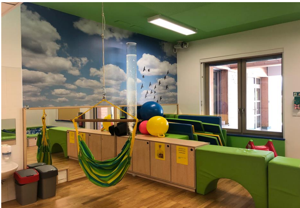
»Terapevtske pravljice«, senzorne škatle, taktilne vrečke